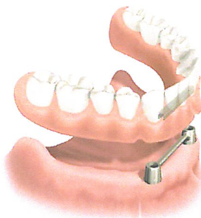
Overkappingsprothese op implantaten

"In samenwerking met een bekende implantaatfabrikant werkten we het onderwijsproject 'orale implantaten' uit. Tijdens het laatste jaar van hun opleiding kunnen studenten nu zelf implantaten plaatsen bij een patiënt en de tandkroon of implantaatprothese vervaardigen. Hiervoor was een beperkte herschikking van het curriculum nodig zodat de student in de voorgaande studie jaren al voldoende preklinische